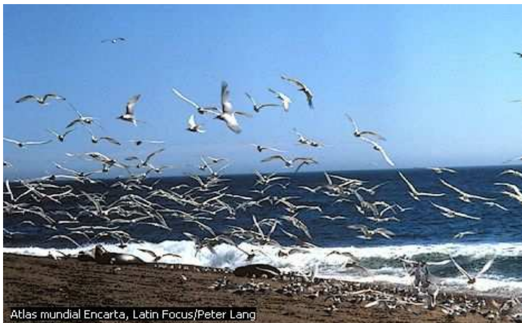
Atlas mundial Encarta, Latin Focus/Peter Lang