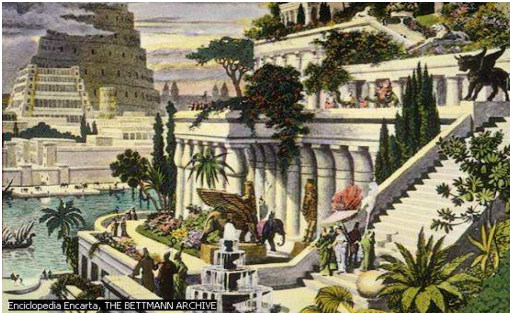
Jardines colgantes de Babilonia - Maarten van Heemskerck - Siglo XVI